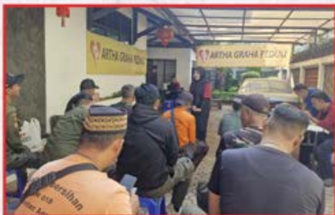
Bakti Sosial Penyuluhan Kesehatan dan Pembagian Sembako di Rumah Sunter