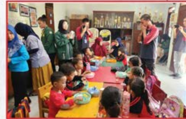
Artha Graha Peduli Unit ECI Cabang Pulo Gadung