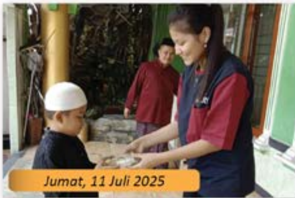
Jumat, 11 Juli 2025

Artha Graha Peduli dan memberikan paket makanan gratis kepada masyarakat. Kegiatan Jumat berkah Artha Graha Peduli ini dilandasi upaya mengajak bersedekah setiap hari Jumat mengingat hari Sabtu dan Minggu mungkin banyak pekerja harian yang kurang beruntung sekaligus berupaya membantu UMKM dengan membeli dan memsubsidi dagangannya untuk dibagikan kepada yang membutuhkan.