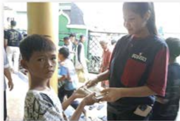
Artha Graha Peduli memberikan paket makanan gratis siap saji kepada warga sekitar Masjid Al Amanah RW 012, Pademangan Timur.