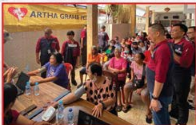
Bakti Sosial Penyuluhan Kesehatan dan Pembagian Sembako di Vihara Avalokitesvara