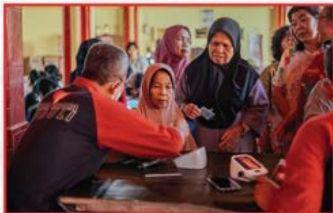
Bakti Sosial Penyuluhan Kesehatan dan Pembagian Sembako di Vihara Atta Naga Vimuthi