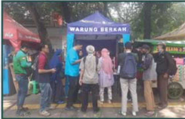
Warung Berkah Artha Graha Peduli di Daerah Jakarta Pusat