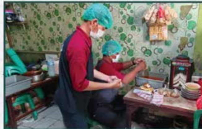
Warung Berkah Artha Graha Peduli di Daerah Jakarta Barat