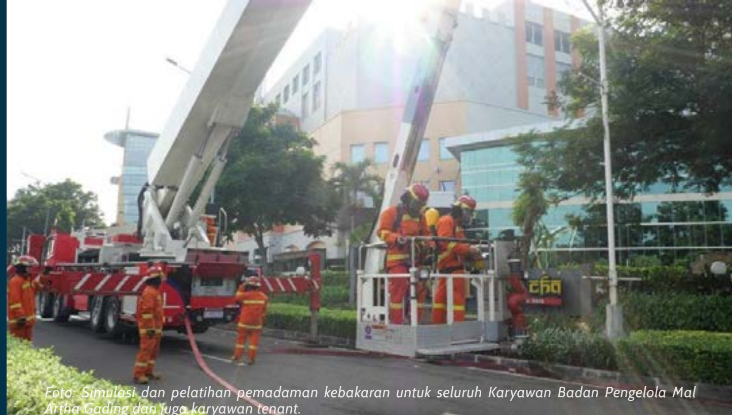
Foto: Simulasi dan pelatihan pemadaman kebakaran untuk seluruh Karyawan Badan Pengelola Mal Artha Gading dan juga karyawan tenant.