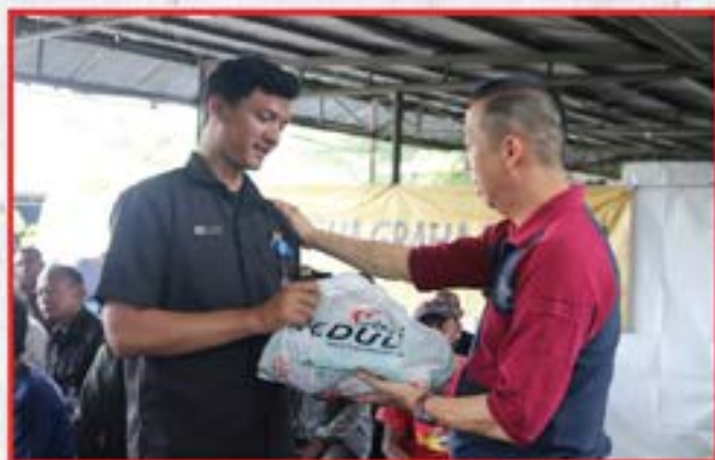
Bakti Sosial Penyuluhan Kesehatan dan Pembagian Sembako di Pasir Putih, Ancol