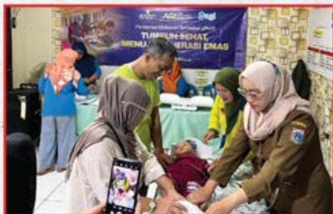
Artha Graha Peduli Unit BAGI Cabang Tanah Abang