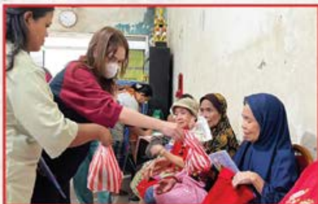
Artha Graha Peduli Unit BAGI Cabang Mangga Besar