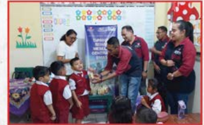
Artha Graha Peduli Unit BAGI Cabang KCP Ambon Diponogoro