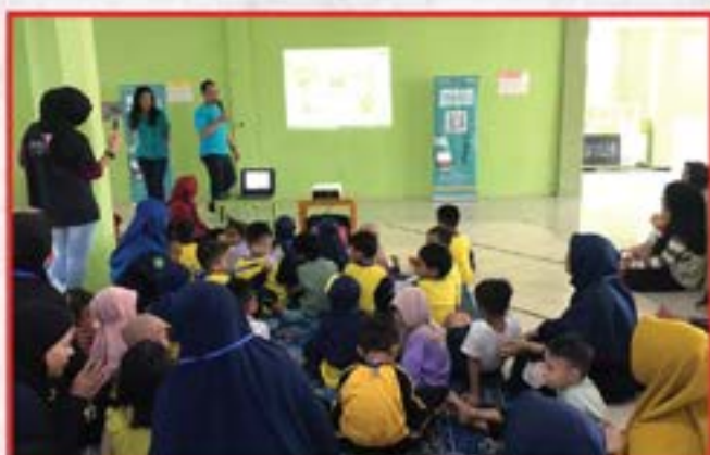
Artha Graha Peduli Unit BAGI Cabang Lampung