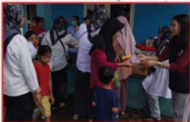
Artha Graha Peduli Unit BAGI Cabang Gading Serpong