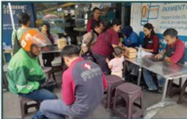
Warung Berkah Artha Graha Peduli di Daerah Jakarta Timur