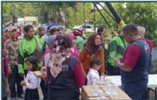
Warung Berkah Artha Graha Peduli di Daerah Jakarta Utara