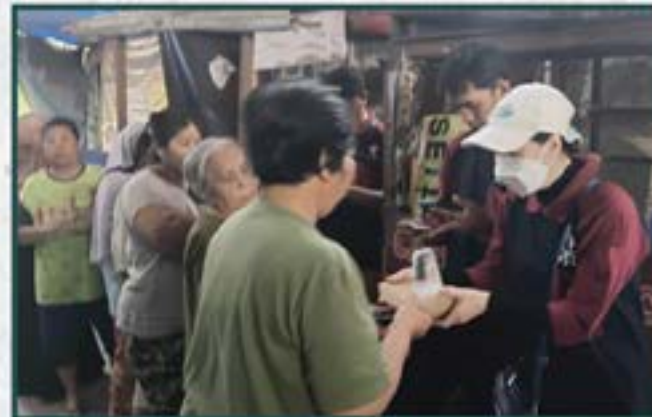
Warung Berkah Artha Graha Peduli di Daerah Jakarta Utara