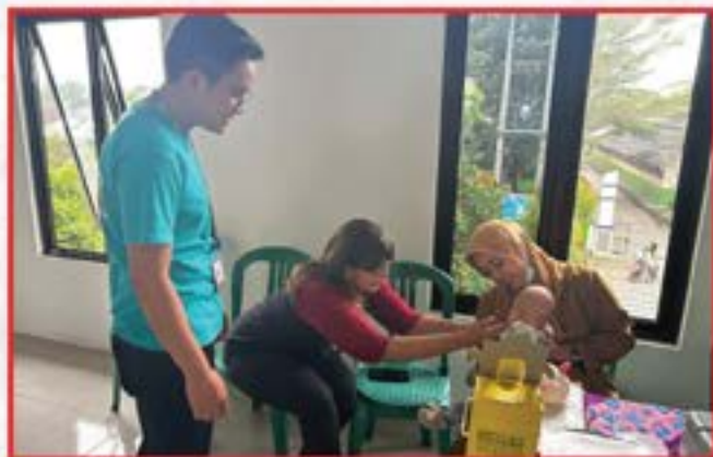
Artha Graha Peduli Unit BAGI Cabang Pangkal Pinang