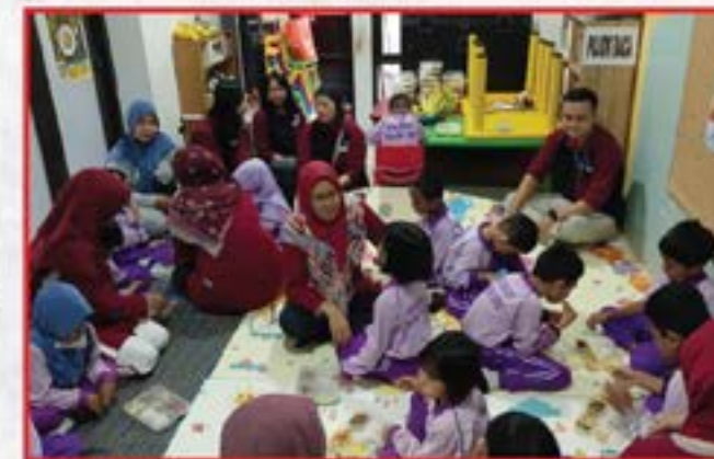
Artha Graha Peduli Unit Sudirman Central Business District