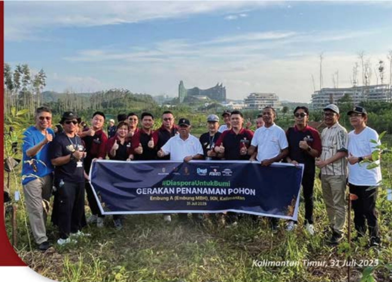
Kalimantan Timur, 31 Juli 2025