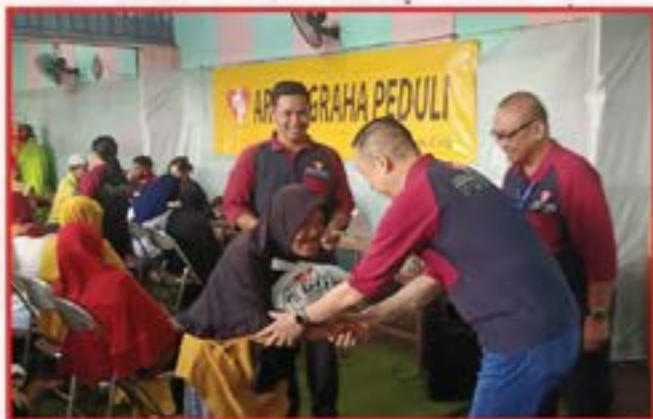
Bakti Sosial Penyuluhan Kesehatan dan Pembagian Sembako di Yayasan Makna Bakti