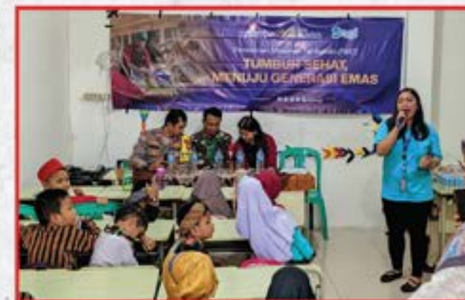
Artha Graha Peduli Unit BAGI Cabang Puri