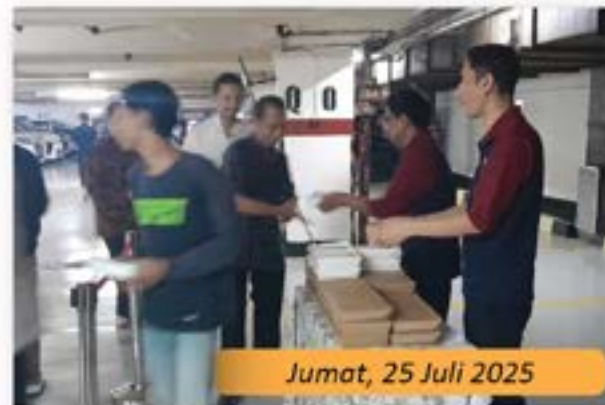
Jumat, 25 Juli 2025