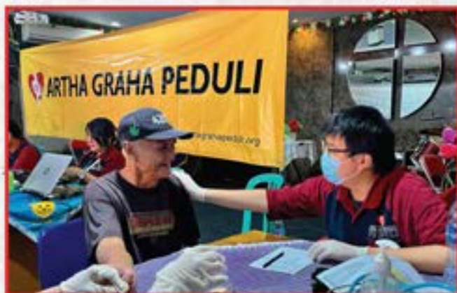
Bakti Sosial Penyuluhan Kesehatan dan Pembagian Sembako di Gereja Kristen Bersinar