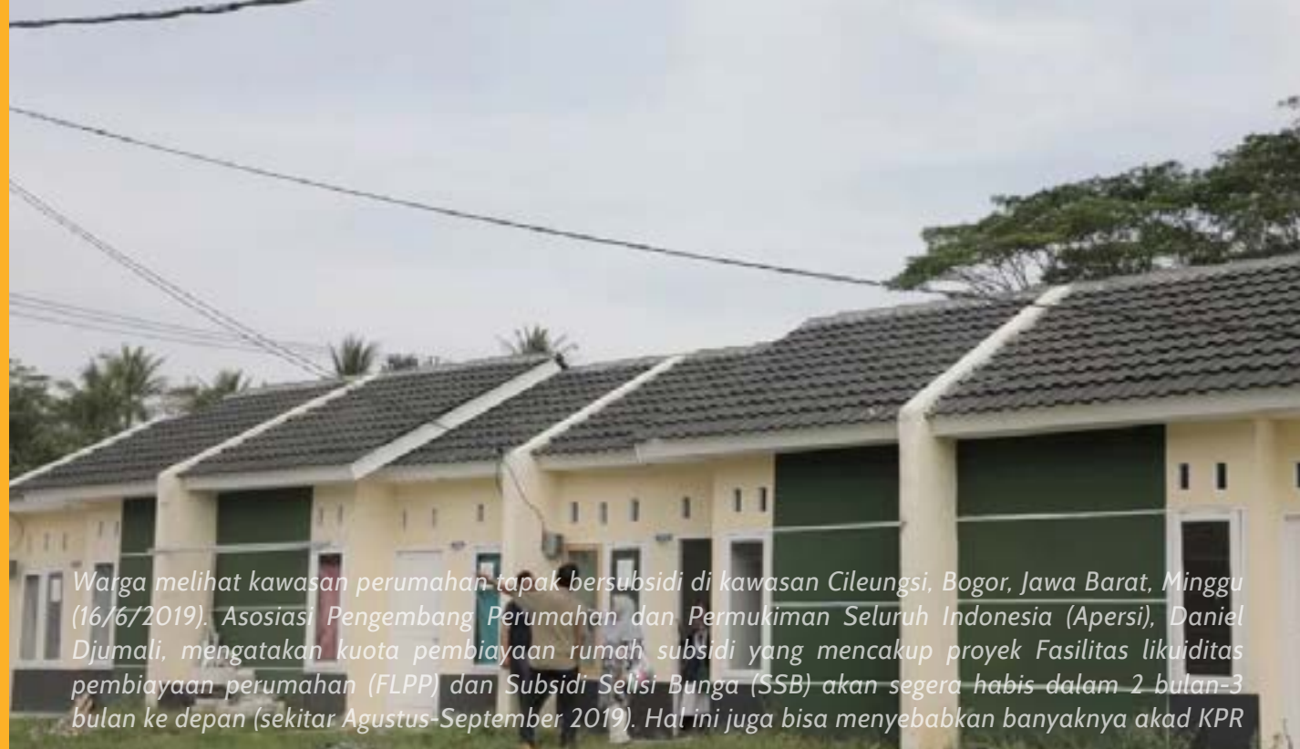
Warga melihat kawasan perumahan tapak bersubsidi di kawasan Cileungsi, Bogor, Jawa Barat, Minggu (16/6/2019). Asosiasi Pengembang Perumahan dan Permukiman Seluruh Indonesia (Apersi), Daniel Djumali, mengatakan kuota pembiayaan rumah subsidi yang mencakup proyek Fasilitas likuiditas pembiayaan perumahan (FLPP) dan Subsidi Selis Bunga (SSB) akan segera habis dalam 2 bulan-3 bulan ke depan (sekitar Agustus-September 2019). Hal ini juga bisa menyebabkan banyaknya akad KPR