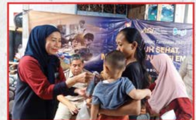
Artha Graha Peduli Unit BAGI Cabang KCP Cokroaminoto