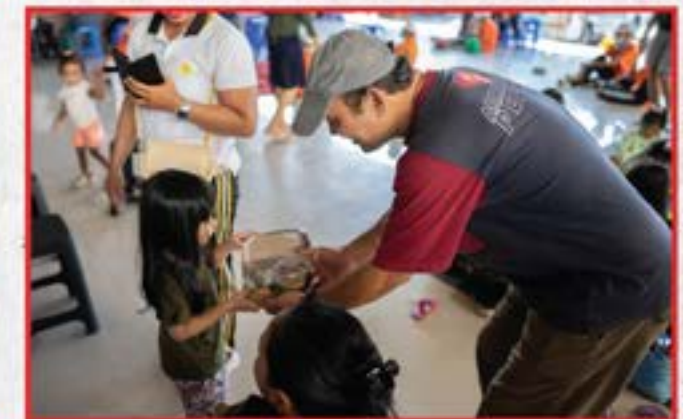
Artha Graha Peduli Unit Discovery Kartika Plaza Hotel Bali