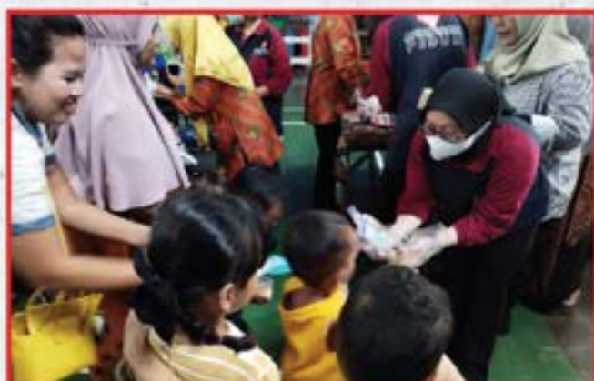
Artha Graha Peduli Unit BAGI Cabang Karet Surabaya