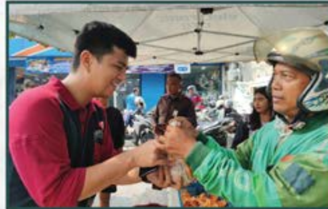
Warung Berkah Artha Graha Peduli di Daerah Jakarta Selatan