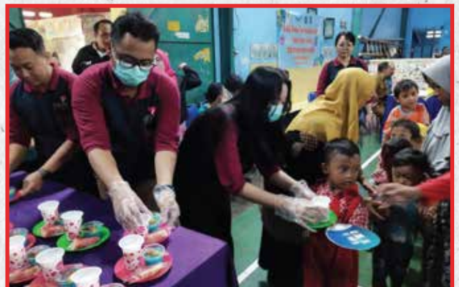
Artha Graha Peduli Unit BAGI Cabang Karet Surabaya