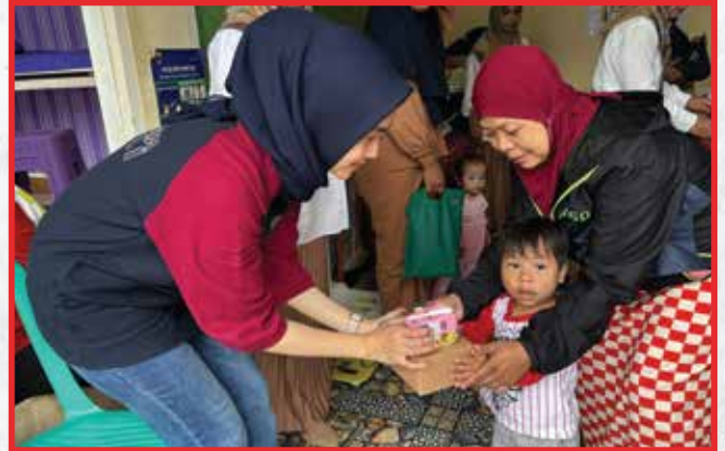
Artha Graha Peduli Unit Palace Hotel Cipanas