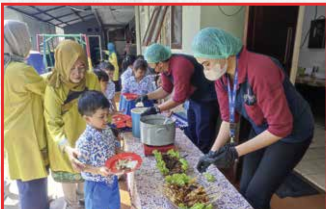
Artha Graha Peduli Unit. Sudirman Central Business District