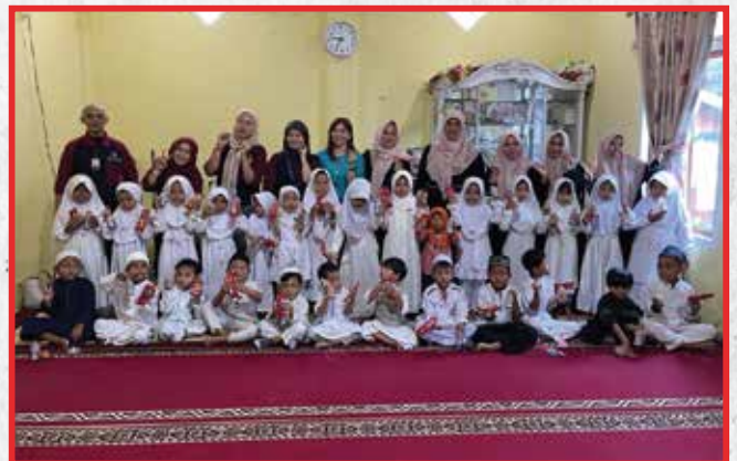
Artha Graha Peduli Unit BAGI Cabang Jambi