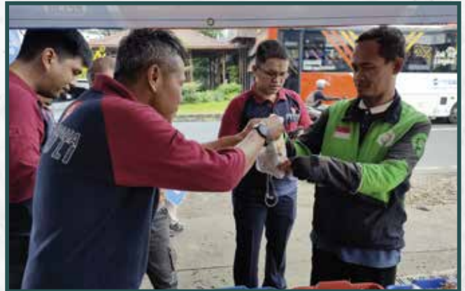
Warung Berkah Artha Graha Peduli di Daerah Jakarta Selatan