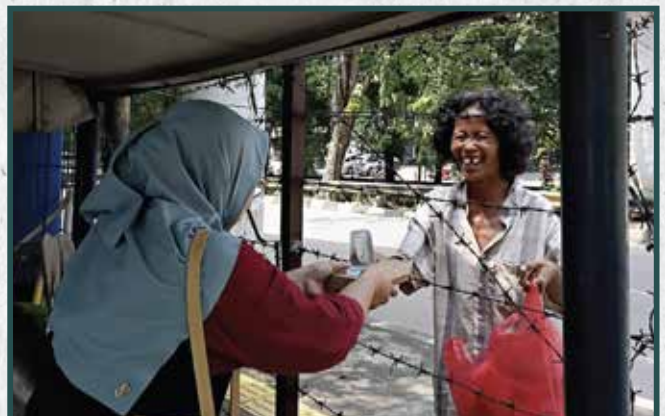
Warung Berkah Artha Graha Peduli di Daerah Jakarta Utara