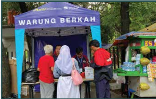
Warung Berkah Artha Graha Peduli di Daerah Jakarta Pusat