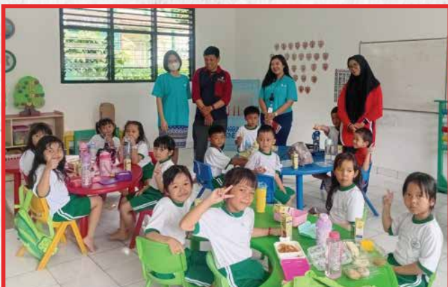
Artha Graha Peduli Unit BAGI Cabang Cab. Palembang