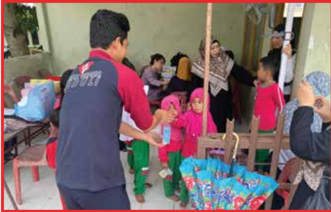
Artha Graha Peduli Unit BAGI Cabang Batam