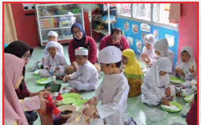
Artha Graha Peduli Unit BAGI Cabang Cab. Medan Pemuda