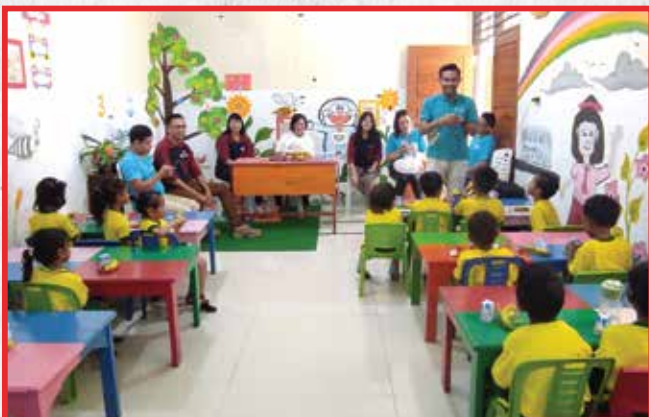
Artha Graha Peduli Unit BAGI Cabang KC Kupang