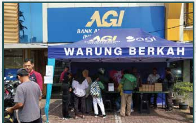
Warung Berkah Artha Graha Peduli di Daerah Jakarta Barat