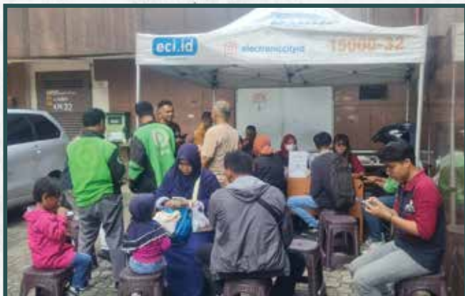
Warung Berkah Artha Graha Peduli di Daerah Jakarta Timur