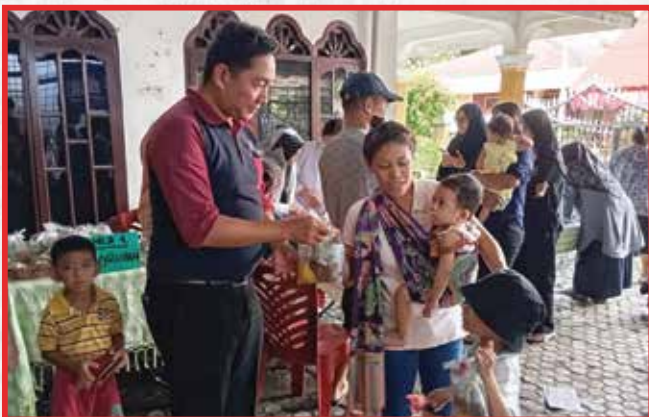
Artha Graha Peduli Unit BAGI Cabang Cemara Asri Medan