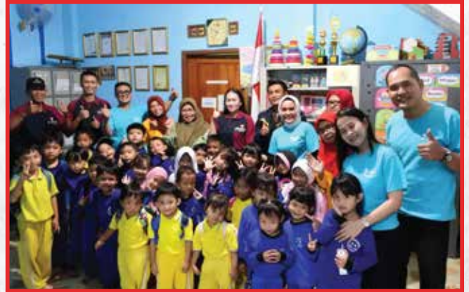
Artha Graha Peduli Unit BAGI Cabang BKR Bandung