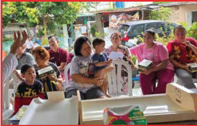
Artha Graha Peduli Unit Hotel Borobudur Jakarta