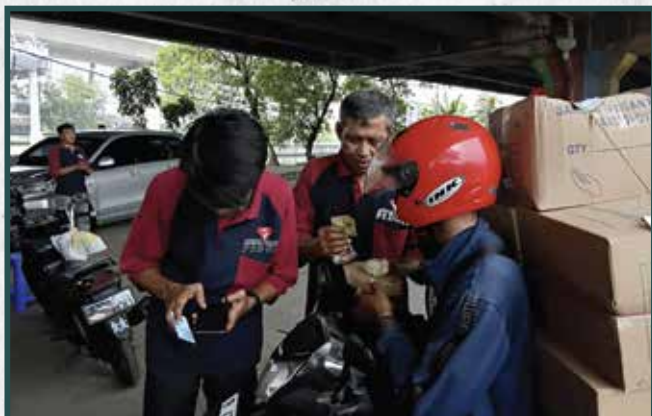
Warung Berkah Artha Graha Peduli di Daerah Jakarta Utara