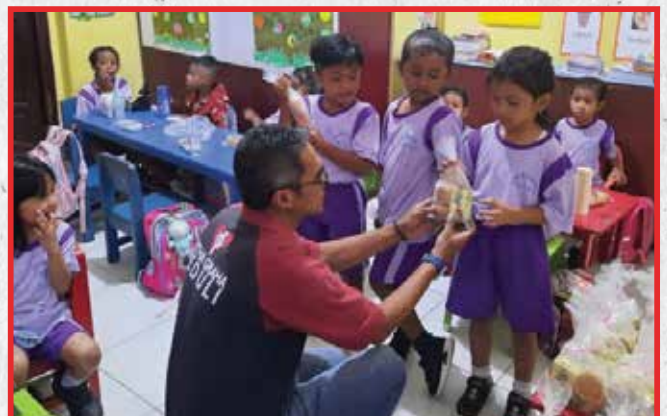
Artha Graha Peduli Unit BAGI Cabang Cab. Ambon