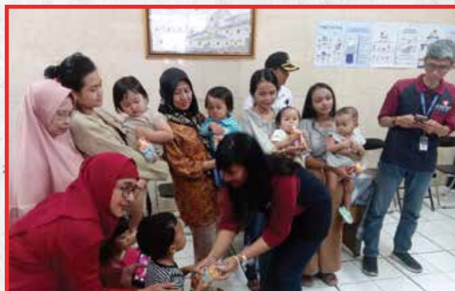
Artha Graha Peduli Unit Kiara Artha Park