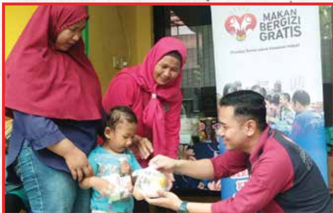
Artha Graha Peduli Unit BAGI Cab. Wiladatika