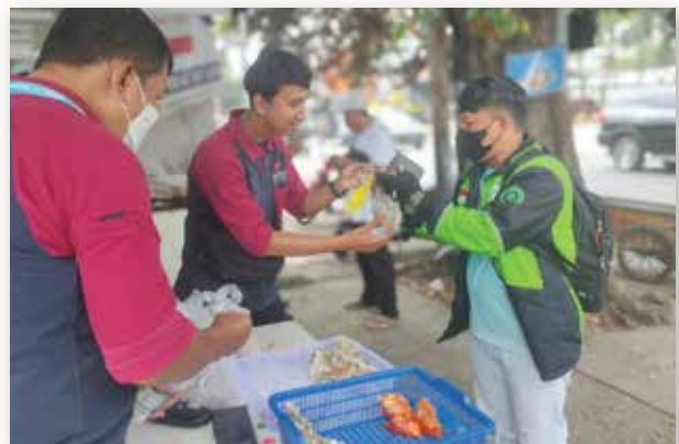
Artha Graha Peduli memberikan paket makanan siap saji bersubsidi kepada warga di Sekitar Jl. Ampera Raya, Kel. Ragunan, Jakarta Selatan.