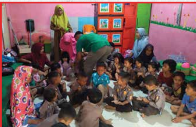
Artha Graha Peduli Unit PT Mitra Aneka Rezeki Banyuasin