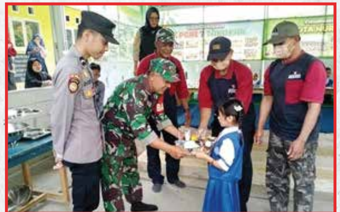
Artha Graha Peduli Unit PT Harmoni Nirwana Lestari