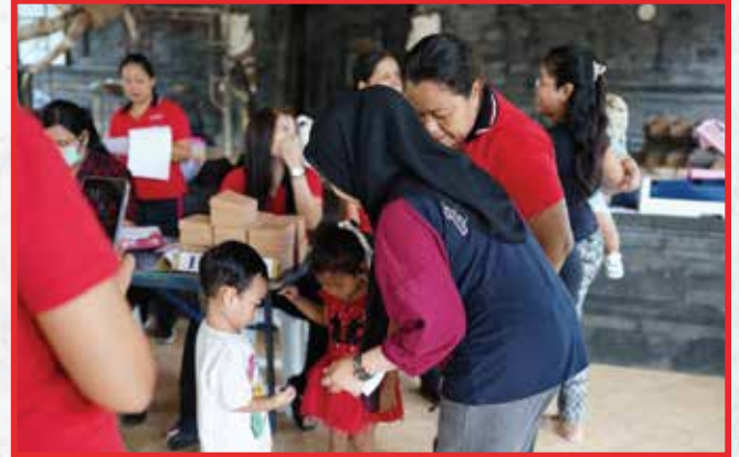
Artha Graha Peduli Unit Discovery Kartika Plaza Hotel Bali