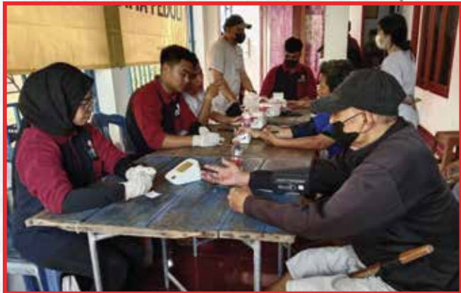
Vihara Attanaga Vimuthi, Tangerang