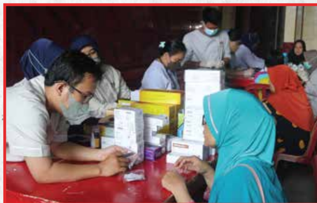
Vihara Matahari Timur, Jakarta Utara