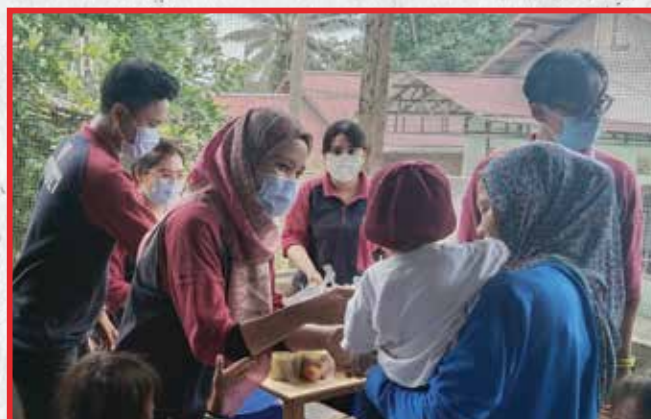
Artha Graha Peduli Unit BAGI Cab. Bintaro