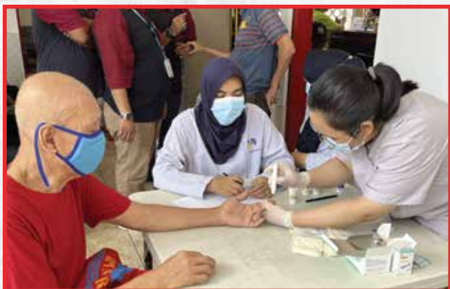
Vihara Avalokitesvara, Jakarta Barat