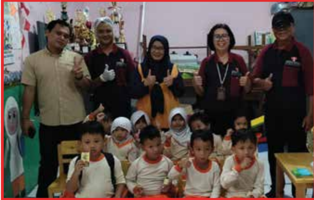
Artha Graha Peduli Unit Hotel Borobudur Jakarta