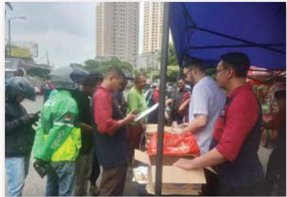
Artha Graha Peduli memberikan paket makanan siap saji bersubsidi kepada warga di depan gerbang barat Ancol, Jakarta Utara.