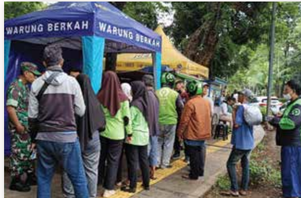
Artha Graha Peduli memberikan paket makanan siap saji bersubsidi kepada warga di Lapangan Banteng, Jakarta Pusat.