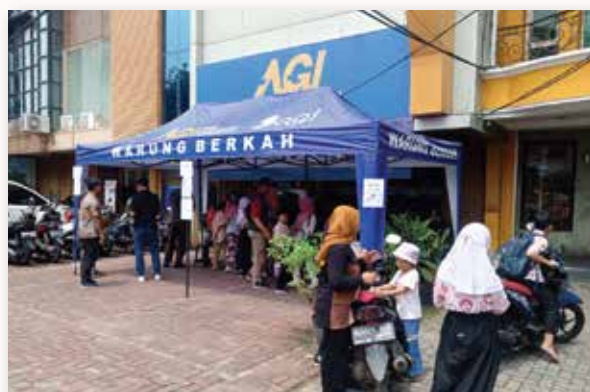
Artha Graha Peduli memberikan paket makanan siap saji bersubsidi kepada warga di sekitar BAGI GreenVille, Jakarta Barat.