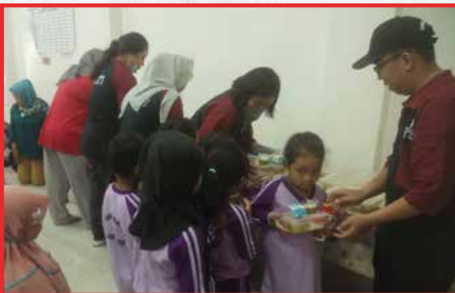
Artha Graha Peduli Unit Discovery Ancol