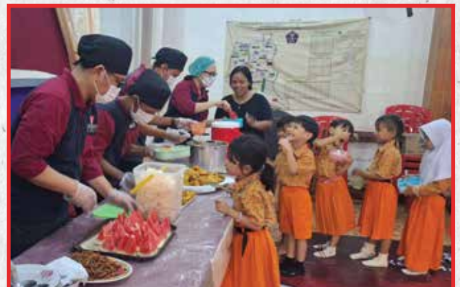
Artha Graha Peduli Unit Sudirman Central Business District