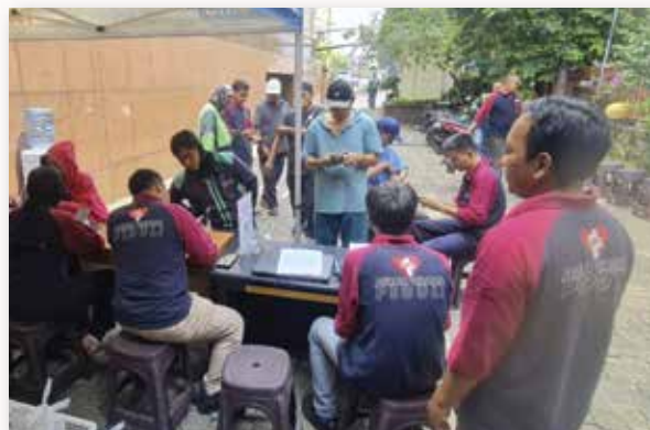
Artha Graha Peduli memberikan paket makanan siap saji bersubsidi kepada warga di sekitar BAGI Cab Matraman, Jakarta Timur.