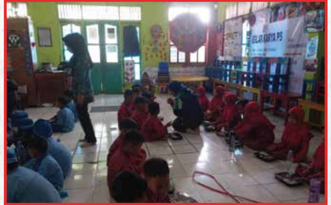
Artha Graha Peduli Unit Artha Industrial Hill