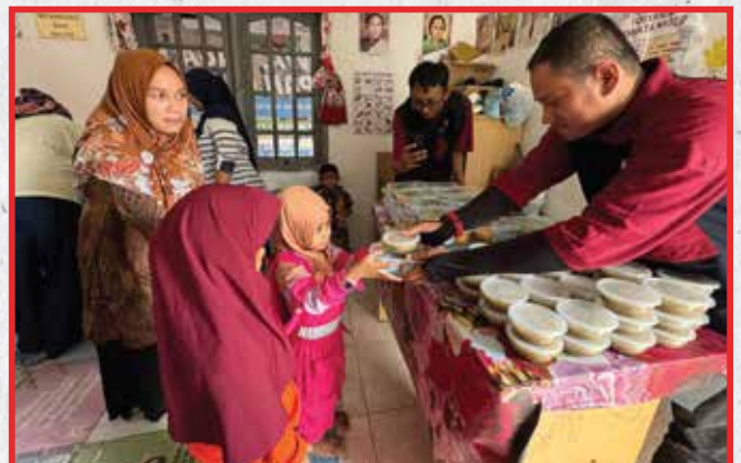
Artha Graha Peduli Unit Makmur Elok Graha