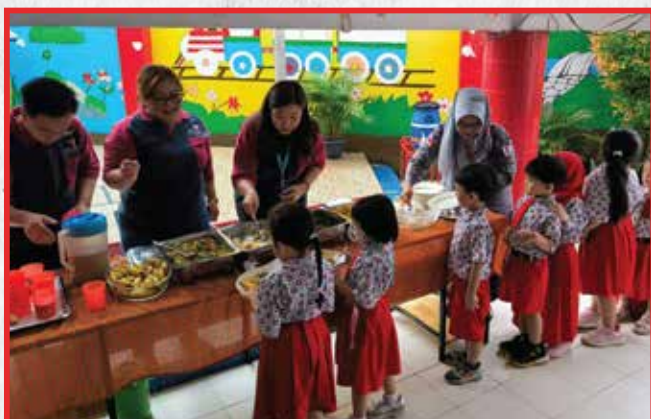
Artha Graha Peduli Unit BAGI Cab. Palembang