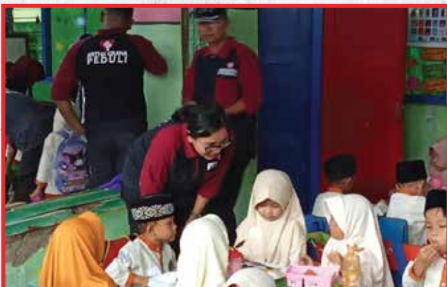
Artha Graha Peduli Unit PT Industri Gula Nusantara