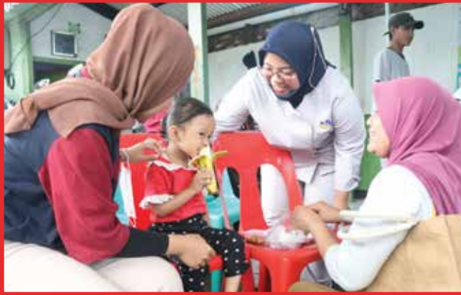
Yayasan Artha Graha Peduli