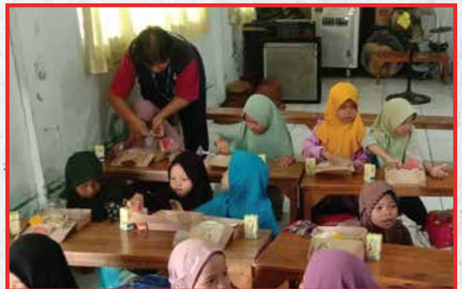
Artha Graha Peduli Unit Sekuriti Grup Artha