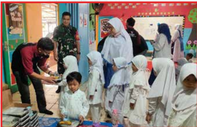
Artha Graha Peduli Unit PT. Pesona Inti Rasa Bogor