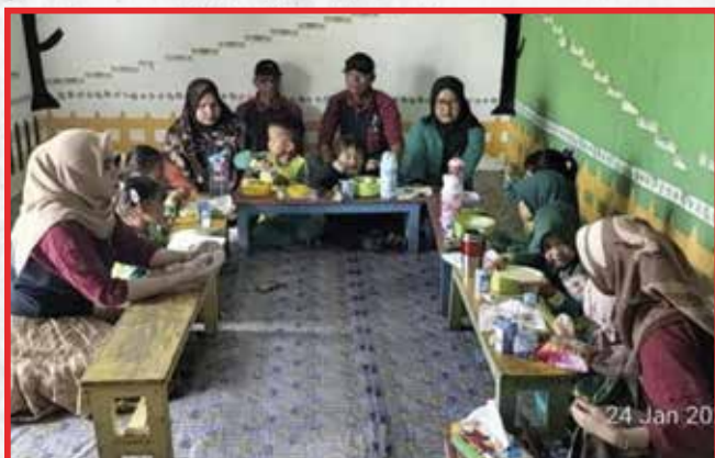
Artha Graha Peduli Unit PT. Marketindo Selaras