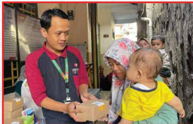
Artha Graha Peduli Unit Palace Hotel Cipanas