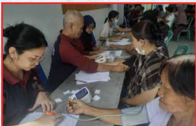
Vihara Dhamma Loka, Tangerang