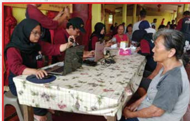
Vihara Bahtera Bhakti, Jakarta Utara