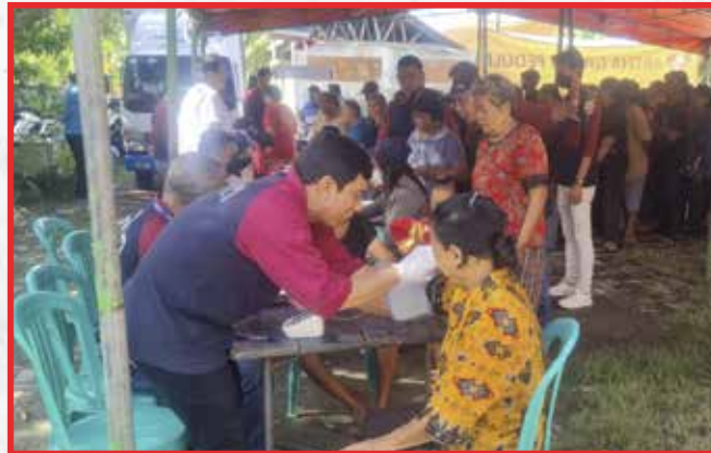
Vihara Tridharma Guna, Tangerang